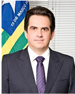
Ciro Nogueira PP/PI