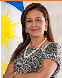
Kátia Abreu PMDB/TO