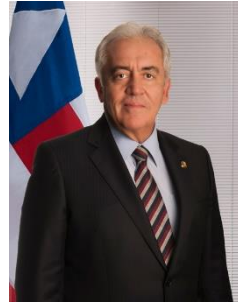
Membro titular da Comissão

Diretório Nacional; Usiminas mecânica S.A Comitê Financeiro Único; Gerdau Comercial de Aços S/A Companhia Metalúrgica Prada; Votorantim Industrial S.A. EIT Empresa Industrial Técnica S.A.; Banco Fator S/A Itaú Unibanco S.A