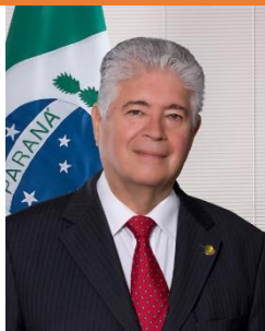
Roberto Requião PMDB/PR