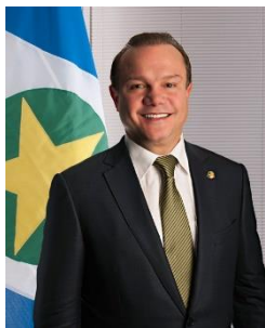
Membro titular da Comissão