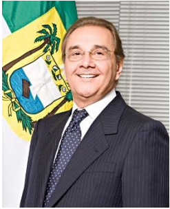
Membro titular da Comissão