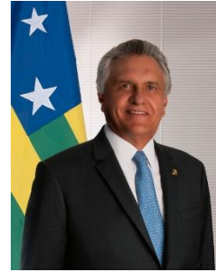
Ronaldo Caiado DEM/GO