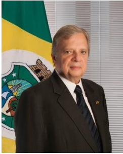
Tasso Jereissati PSDB/CE