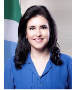
Membro titular da Comissão