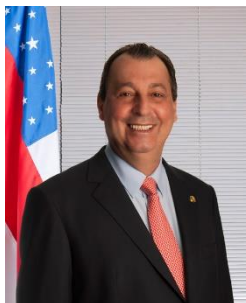
Membro titular da Comissão