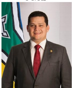
Davi Alcolumbre DEM/AP