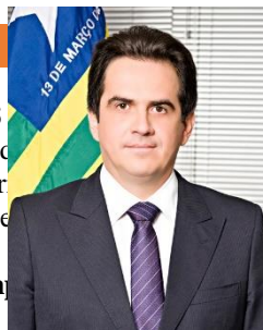
Membro titular da Comissão

Sovel da Amazonia LTDA ; Partido Social Democratico-psd Diretório Nacional; Office Informatica LTDA; Pr Construções e Terraplenagem LTDA.