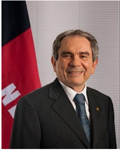
Membro titular da Comissão