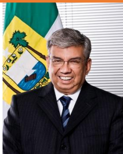
Garibaldi Alves Filho PMDB/RN