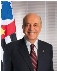
Membro titular da Comissão