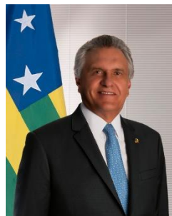
Membro titular da Comissão

Iguatemi Empresa de Shopping Centers S/A; Cosan Lubrificantes e Especialidades S.A; Bradesco Vida e Previdência S/A; Itaú Unibanco S/A; JBS S.A.