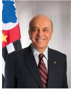
José Serra PSDB/SP